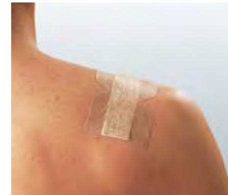
Kein Verkleben mit der Wunde.

Nur die Peelpackungen der Hansaplast® Soft Strips enthalten Naturkautschuklatex, wodurch Allergien ausgelöst werden können.