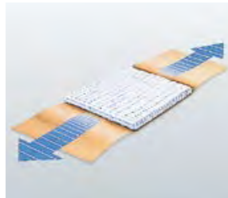
Kein Verkleben mit der Wunde.

Nur die Peelpackungen der Hansaplast® Elastic Fingerkuppenpflaster enthalten Naturkautschuklatex, wodurch Allergien ausgelöst werden können.