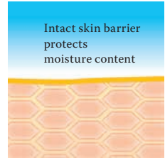
Intact protective skin barrier with lipids rich in linoleic acids.

Further information can be found at www.linola.com