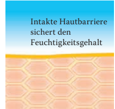
Intakte, schützende Hautbarriere mit Linolsäure-reichen Lipiden

Weitere Informationen stehen für Sie bereit unter www.linola.de