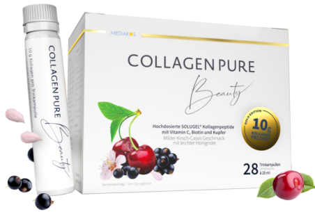
COLLAGEN PURE Beauty