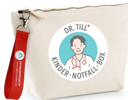
Sonderedition 2021 (ausver- kauft)