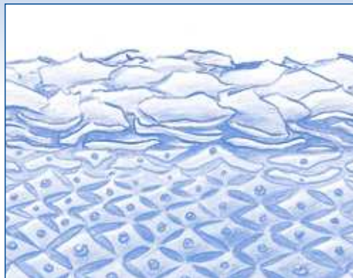
Gestörte Schutzbarriere durch z.B. häufiges Waschen

so sehr gestört werden, dass die natürliche Regeneration nur langsam erfolgt. Sie bemerken die Schädigung der Hautschutzbarriere daran, dass sich Ihre Haut rau und trocken anfühlt, spannt oder Risse entstehen.