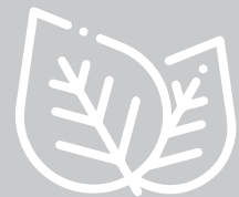
Sekundäre Pflanzenstoffe (Superfoods)