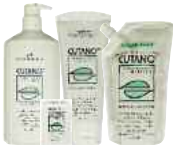
Waschpflege fest 100 g Waschpflege flüssig 200 ml Waschpflege flüssig 500 ml im Spender Waschpflege flüssig 500 ml im Nachfüllpack