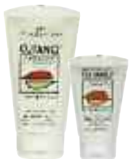
Pflegebalsam 150 ml Pflegecreme 50 ml