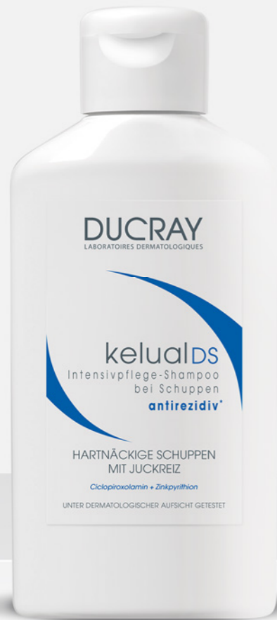
kelual DS Shampoo

*Icomed Studie 2015: Empfehlungshäufigkeit von Shampoos gegen seborrhoische Dermatitis