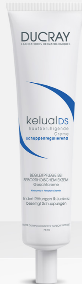
kelual DS Beruhigende Creme