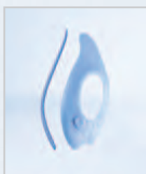
Korrekturzügel und Patellapelotte