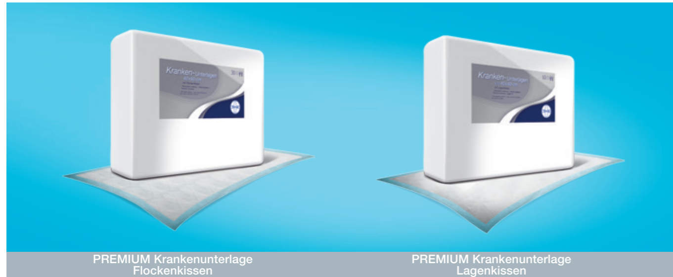
PREMIUM Krankenunterlage Flockenkissen