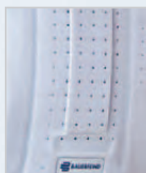
perforierter Verschluss mit Luftporen