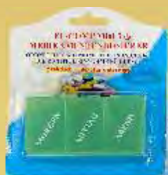
Tagesdosierer für 3 Tageszeiten

Dank dieser Kassetten können die Medikamente für den ganzen Tag geplant werden. Es erleichtert die Dosierung besonders den Kindern oder älteren Menschen.