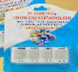
Tagesdosierer für 4 Tageszeiten