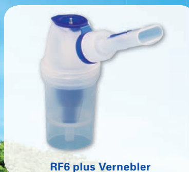
RF6 plus Vernebler