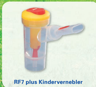
RF7 plus Kindervernebler