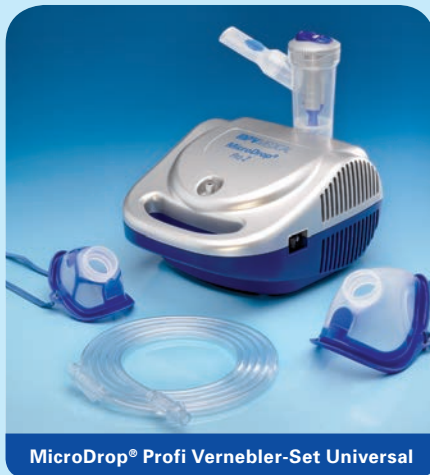
MicroDrop® Profi Vernebler-Set Universal

Inhalt: Vernebler RF6 plus, Mundstück mit Ausatemventil, Druckluftschlauch, Schlauchtülle, inkl. Kinder- (M 50020-42600) und Erwachsenenmaske (M 50020-42500).