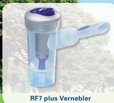
RF7 plus Vernebler