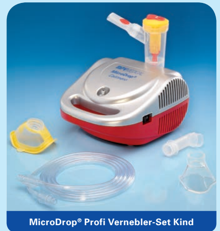
MicroDrop® Profi Vernebler-Set Kind

Inhalt: Vernebler RF7 plus, Mundstück mit Ausatemventil, Druckluftschlauch, Schlauchtülle, inkl. Soft-Kinder- (M 50020-44000) und Soft-Erwachsenenmaske (M 50020-44100) in blau.