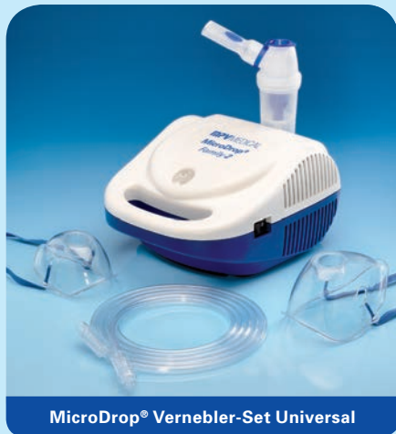
MicroDrop® Vernebler-Set Universal

Sowohl mit den MicroDrop® Kompressoren, als auch mit anderen Kompressoren und mit Druckluftflowmetern: