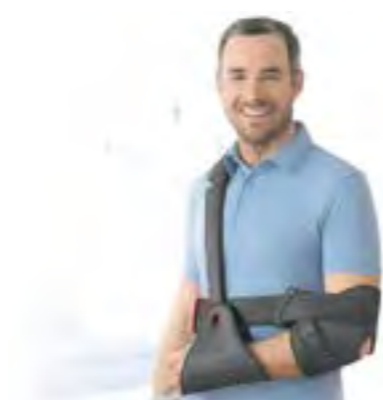
Intuitiv, schnell, sicher: Tricodur® Gilchrist Smart