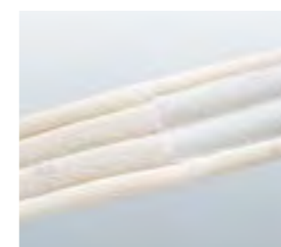
Das zugfesteste Material garantiert eine hohe Stabilität.

Tricodur® Clavicula besteht aus Polyester, Polyamid, Polyurethan und einem Polypropylenring und ist bei 30°C waschbar.