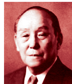
Manji Wakunaga (1910–1992)

Die Entwicklung des besonderen Reifungsverfahrens zur Herstellung des Aged Garlic Extracts ist bis heute ein weltweit anerkannter Meilenstein in der Heilpflanzenwissenschaft.