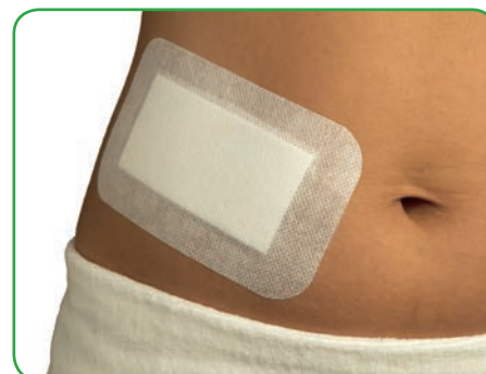
Verband sanft und spannungsfrei auf der Haut anbringen.