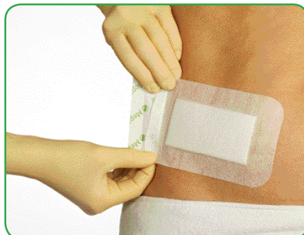
Die überlappende Schutzfolie in die Hand nehmen und über die Wunde platzieren.