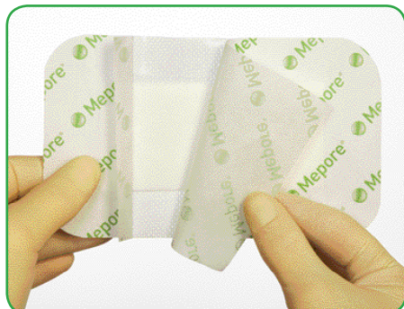
Verpackung öffnen und Verband entnehmen.