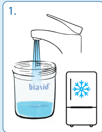
Trinkwasser kalt stellen