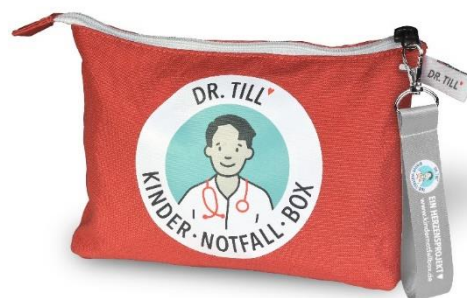
Klassiker 2022 limitierte Auf- lage)