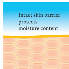
Intact protective skin barrier with lipids rich in linoleic acids.

Visit us at www.linola.de and select the dropdown menu "country". Here you will find all the latest information on Linola Lotion , Linola Face , Linola Hand and Linola Foot Lotion as well as other Linola products for a wide range of skin problems.