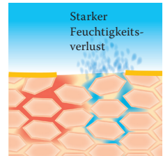
Lipidverlust führt zu einer gestörten Hautbarriere: Die Haut verliert viel Wasser und trocknet aus.