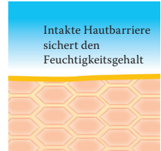
Intakte, schützende Hautbarriere mit Linolsäure-reichen Lipiden.

Besuchen Sie uns unter www.linola.de . Denn dort haben wir für Sie alle aktuellen Informationen über Linola Hautmilch , Linola Gesicht , Linola Hand und Linola Fuß-Milch sowie zu weiteren Linola-Produkten bei verschiedenen Hautproblemen bereitgestellt.