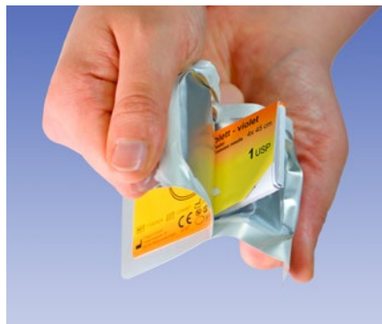
2. Öffnen der Folie durch gleichmäßiges Aufziehen.