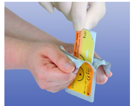
3. Aseptische Entnahme des Fadenträgers.