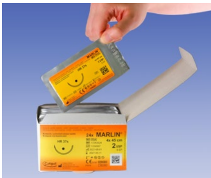
1. Entnahme der Folie aus der Box.