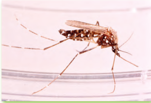
Klein, aber gemein: Die Asiatische Tigermücke