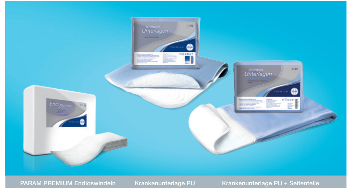
PARAM PREMIUM Endloswindeln