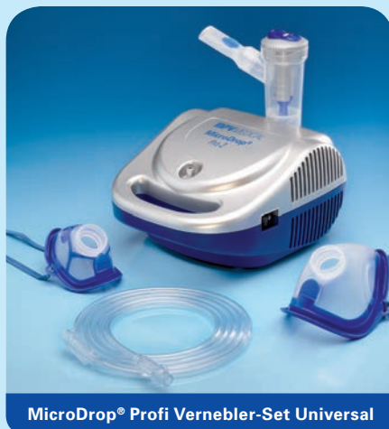
MicroDrop® Profi Vernebler-Set Universal

Inhalt: Vernebler RF6 plus, Mundstück mit Ausatemventil, Druckluftschlauch, Schlauchtülle, inkl. Kinder- (M 50020-42600) und Erwachsenenmaske (M 50020-42500).