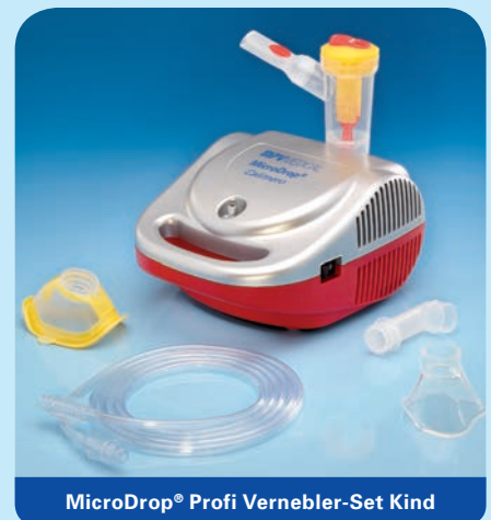
MicroDrop® Profi Vernebler-Set Kind

Inhalt: Vernebler RF7 plus, Mundstück mit Ausatemventil, Druckluftschlauch, Schlauchtülle, inkl. Soft-Kinder- (M 50020-44000) und Soft-Erwachsenenmaske (M 50020-44100) in blau.