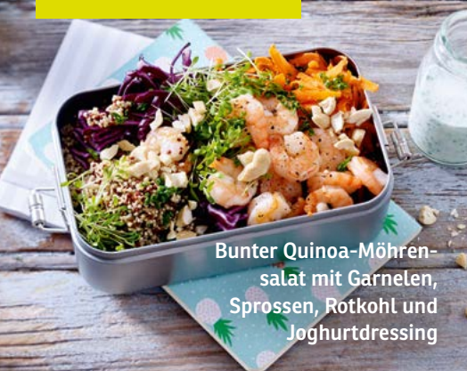
Bunter Quinoa-Möhrensalat mit Garnelen, Sprossen, Rotkohl und Joghurdressing