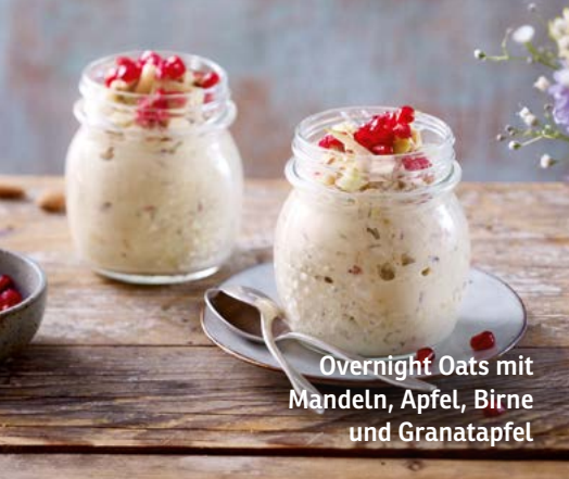
Overnight Oats mit Mandeln, Apfel, Birne und Granatapfel