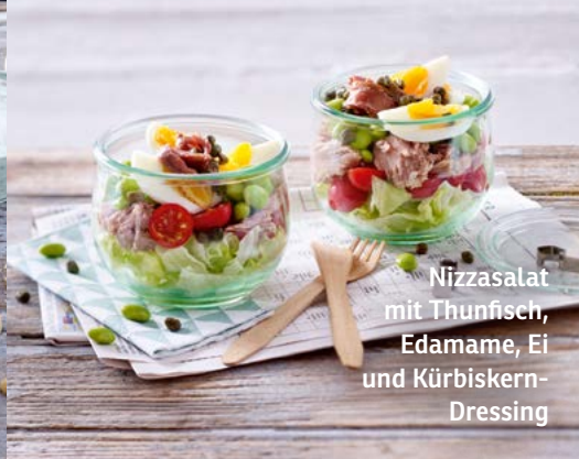
Nizzasalat mit Thunfisch, Edamame, Ei und Kürbiskern-Dressing