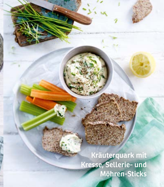
Kräuterquark mit Kresse, Sellerie- und Möhren-Sticks

Zubereitung: Den Quark mit Almased, der Milch und dem Öl glatt rühren. Nach Bedarf ein wenig kaltes Wasser ergänzen. Mit Salz, Pfeffer und Zitronensaft würzen, den Schnittlauch, Basilikum und geschnittene Kresse untermischen und abschmecken. Mit den Sonnenblumenkernen bestreuen. Den Sellerie und die Möhren waschen, putzen, bzw. schälen und beides