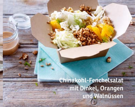
Chinakohl-Fenchelsalat mit Dinkel, Orangen und Walnüssen