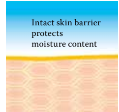
Intact protective skin barrier with lipids rich in linoleic acids.

Visit us at www.linola.de and select the drop-down menu "country". Here you will find all the latest information on Linola Lotion , Linola Face , Linola Hand and Linola Foot Lotion as well as other Linola products for a wide range of skin problems.