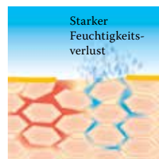
Lipidverlust führt zu einer gestörten Hautbarriere: Die Haut verliert viel Wasser und trocknet aus.