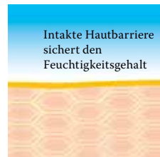
Intakte, schützende Hautbarriere mit Linolsäure-reichen Lipiden.

Um diesen Barrierestörungen sowie Fett- und Feuchtigkeitsdefiziten trockener Haut entgegenzuwirken und sie vor weiteren Schäden zu schützen, ist daher sowohl eine regelmäßige Pflege als auch eine schonende Reinigung unerlässlich. Deshalb gibt es von Linola spezielle Produkte, die aufeinander abgestimmt sind und zudem gerade für den Körper, den Kopf, das Gesicht, die Hände oder die Füße besonders geeignet sind. Besuchen Sie uns unter www.linola.de . Denn dort haben wir für Sie alle aktuellen Informationen über Linola Hautmilch , Linola Gesicht , Linola Hand und Linola Fuß-Milch sowie zu weiteren Linola-Produkten bei verschiedenen Hautproblemen bereitgestellt.