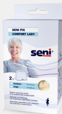
Seni Fix Comfort Lady im attraktiven, femininen Design