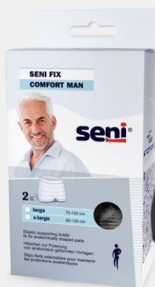
Seni Fix Comfort Man in maskuliner Optik