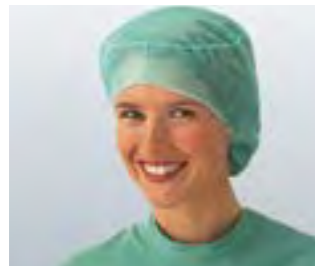
Carpex® Vario, die Schwesternhaube im Astronautenschnitt. Nackenteil mit Gummiband, besonders geeignet bei langen Haaren und Zöpfen.

Carpex® OP-Hauben bestehen aus Polypropylen.