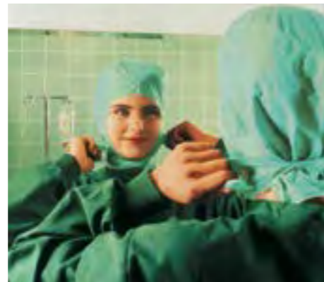
Carpex® Astro, die Vollschutzhaube im Astronautenschnitt mit flachem Kopfteil und Bindeverschluss.