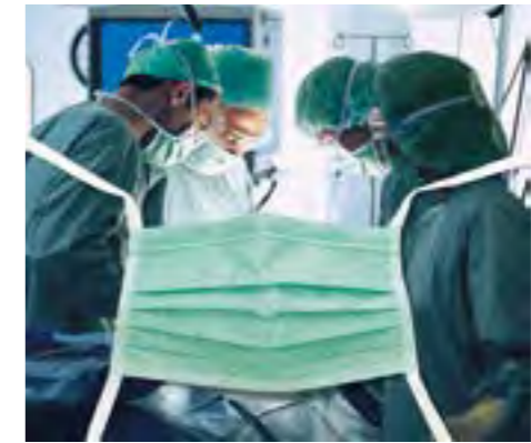
Hohe Filterleistung, sicherer Infektionsschutz, atmungsaktiv.