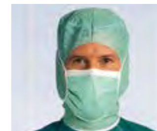
Jede Carpex® OP-Maske verfügt über ein besonders hautfreundliches Innenvlies.

Anwendungsdauer: kurzfristig und bis zu mehreren Stunden