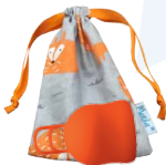
Merula Cup XL fox