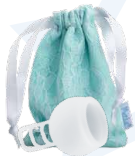
Merula Cup ice