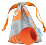
Merula Cup fox