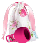
Merula Cup strawberry