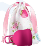
Merula Cup XL strawberry