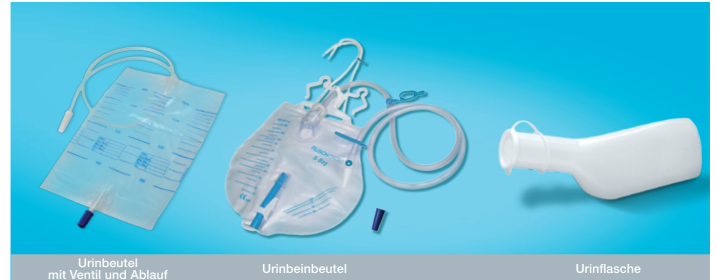
Urinbeutel mit Ventil und Ablauf