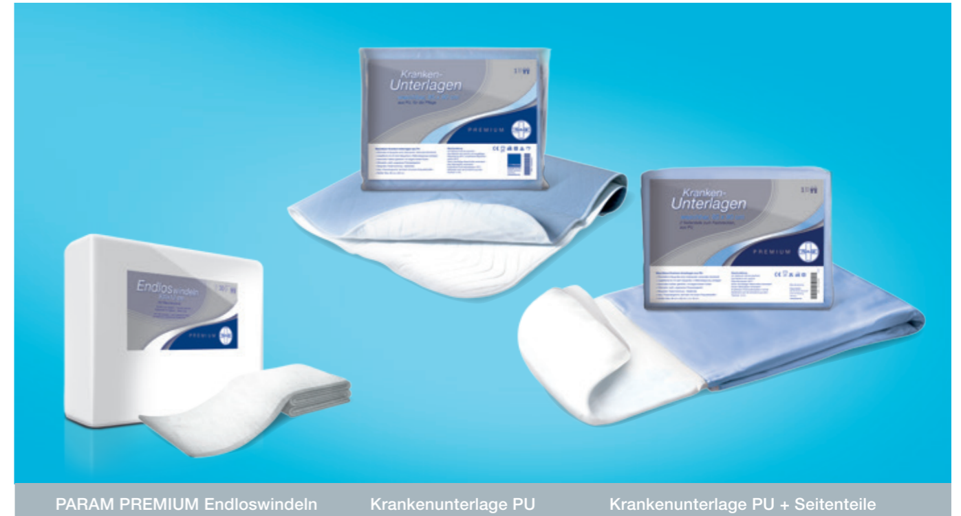
PARAM PREMIUM Endloswindeln