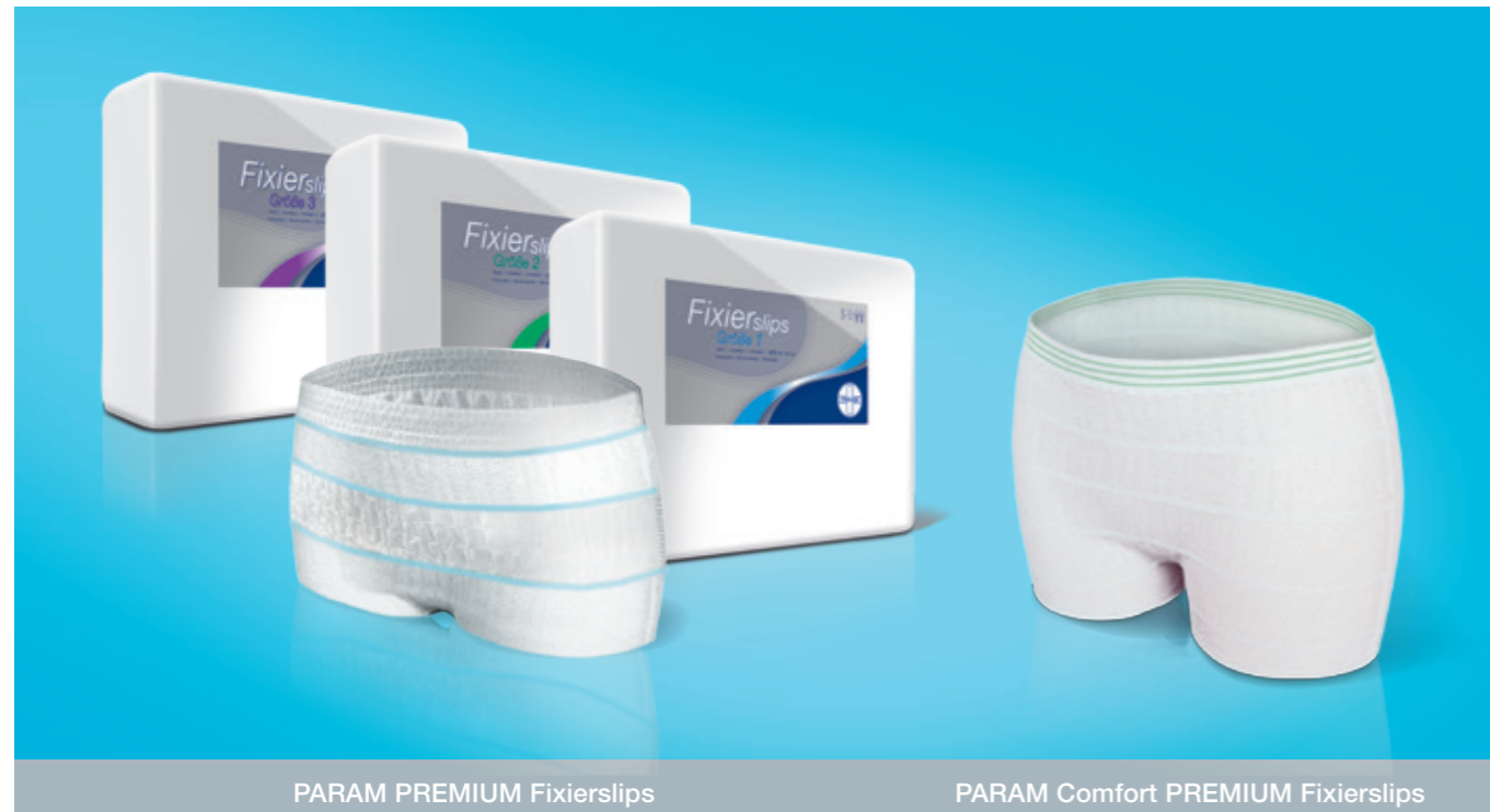
PARAM PREMIUM Fixierslips