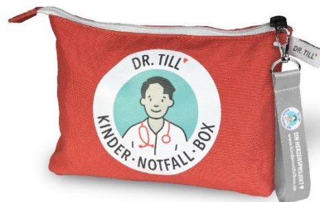
Klassiker 2022 limitierte Auf- lage)