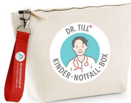
Sonderedition 2021 (ausver- kauft)