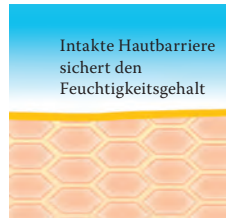
Intakte, schützende Hautbarriere mit Linol-säure-reichen Lipiden.

Besuchen Sie uns unter www.linola.de . Denn dort haben wir für Sie alle aktuellen Informationen über Linola Hautmilch , Linola Gesicht , Linola Hand und Linola Fuß-Milch sowie zu weiteren Linola-Produkten bei verschiedenen Hautproblemen bereitgestellt.