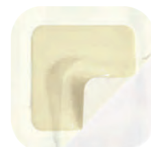
Askina® Transorbent® Border