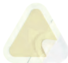
Askina® Transorbent® Sacrum