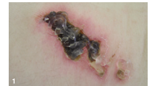
1 Applikation von Purilon Gel auf eine nekrotische Wunde