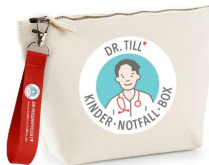
Sonderedition 2021 (ausver- kauft)