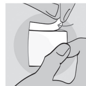
Abbildung 1: Öffnen der Verpackung.

Zum Öffnen reißen Sie die Verpackung auf (Abbildung 1) und entfalten Sie die innenliegende Komresse; verwenden Sie zum Öffnen keine Hilfsmittel.