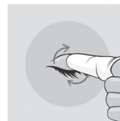
Abbildung 2: Reinigen der Augenlider und Wimpern

Massieren Sie sanft mit kleinen kreisenden Bewegungen und entfernen Sie eventuelle Krusten, Sekrete oder Make-up.