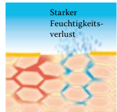
Lipidverlust führt zu einer gestörten Hautbarriere: Die Haut verliert viel Wasser und trocknet aus.