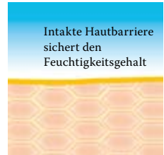
Intakte, schützende Hautbarriere mit Linol-säure-reichen Lipiden.

Besuchen Sie uns unter www.linola.de . Denn dort haben wir für Sie alle aktuellen Informationen über Linola Hautmilch , Linola Gesicht , Linola Hand und Linola Fuß-Milch sowie zu weiteren Linola-Produkten bei verschiedenen Hautproblemen bereitgestellt.