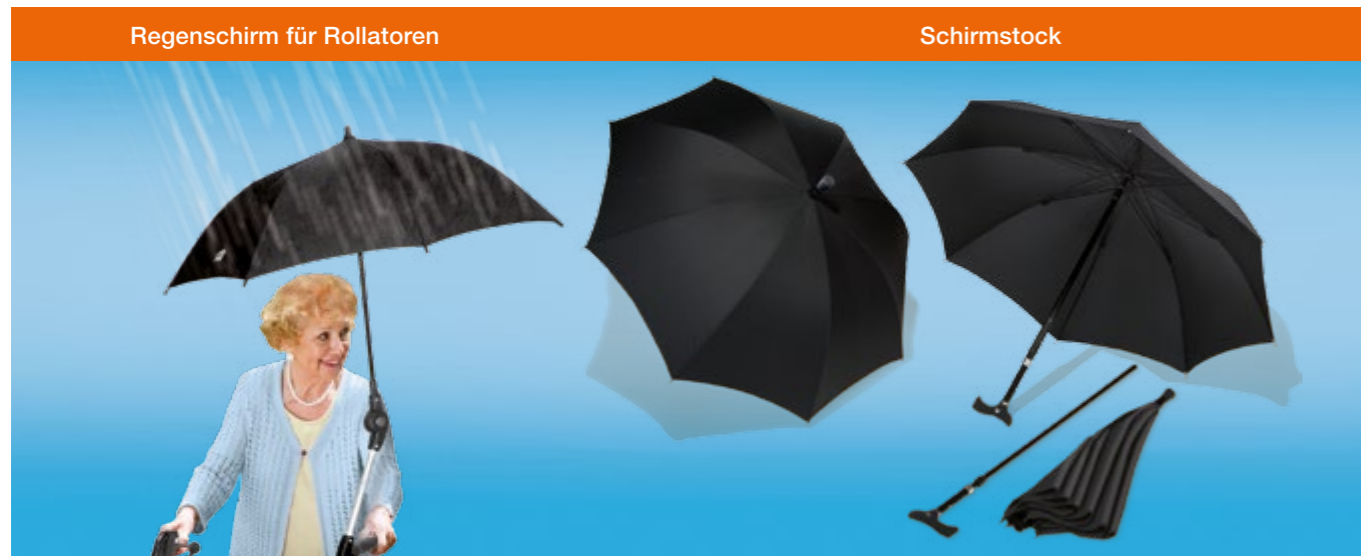
Regenschirm für Rollatoren