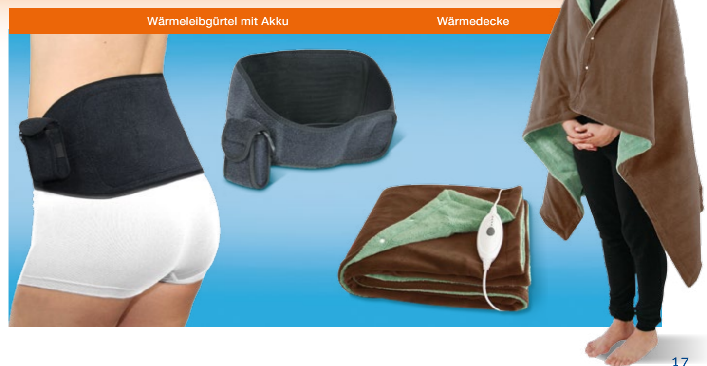
Wärmeleibgürtel mit Akku