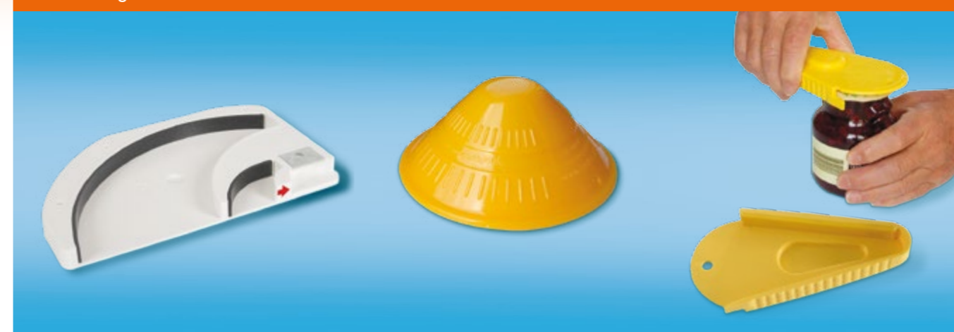
Öffner für Drehverschlüsse