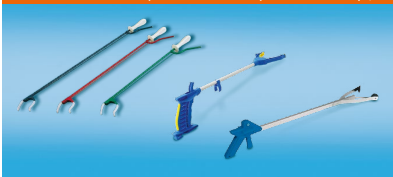
Greifhilfe mit Saugnäpfen