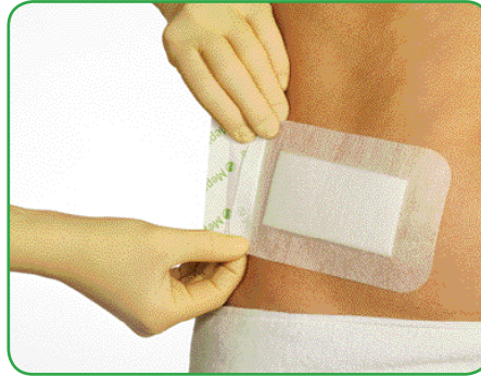
Die überlappende Schutzfolie in die Hand nehmen und über die Wunde platzieren.