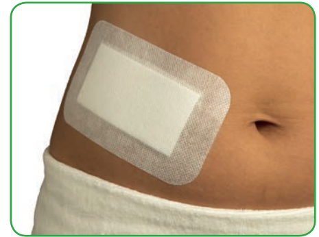
Verband sanft und spannungsfrei auf der Haut anbringen.