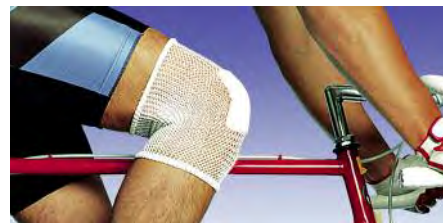
Durch die hohe Elastizität und Rückstellkraft von Stülpa-fix werden Wundauflagen auch bei extremen Bewegungen sicher fixiert.