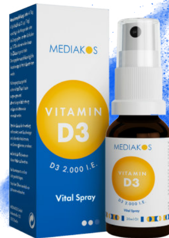
MEDIAKOS Vitamin D3 2.000 I.E. Vital Spray Inhalt: 20 ml. PZN: 18096696