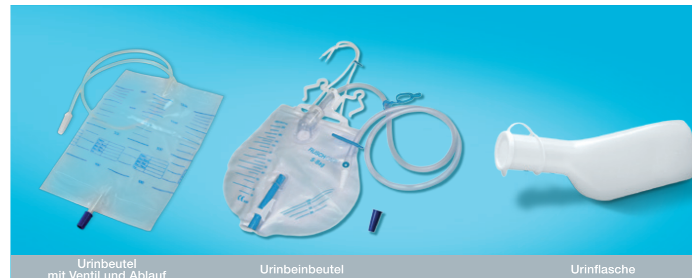
Urinbeutel mit Ventil und Ablauf