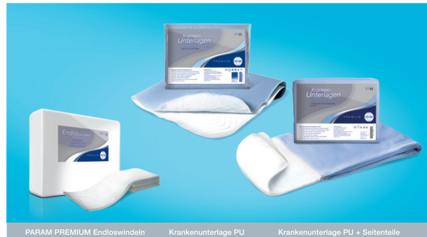
PARAM PREMIUM Endloswindeln