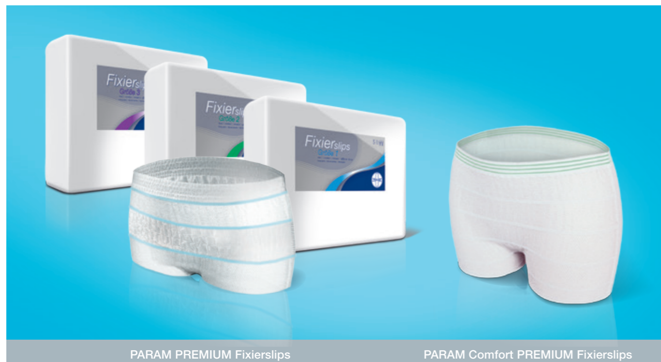
PARAM PREMIUM Fixierslips