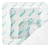
Askina® DresSil Border