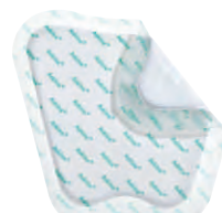
Askina® DresSil Sacrum