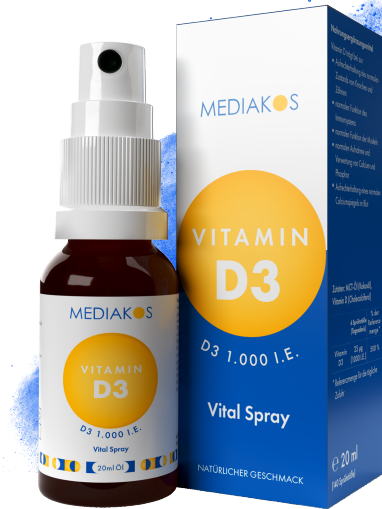
MEDIAKOS Vitamin D3 1.000 I.E. Vital Spray Inhalt: 20 ml. PZN: 18133285