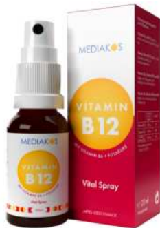
Vitamin B12 + B6 + Folsäure Mediakos Vital Spray 20 ml