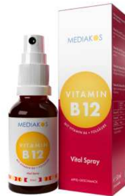
Vitamin B12 + B6 + Folsäure Mediakos Vital Spray 50 ml