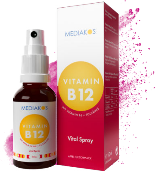
Vitamin B12 + B6 + Folsäure Mediakos Vital Spray Inhalt: 50 ml. PZN: 18317660