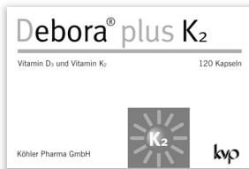
Vitamin D 3 + Vitamin K 2