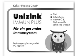
Zink, Beta-Glucan, Vitamine C + E, Bioflavonoide, Selen und Lycopodium