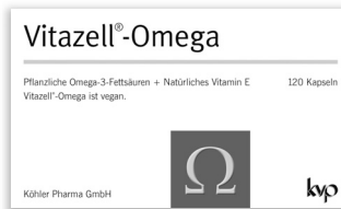
Pflanzliche Omega-3-Fettsauren + naturliches Vitamin E