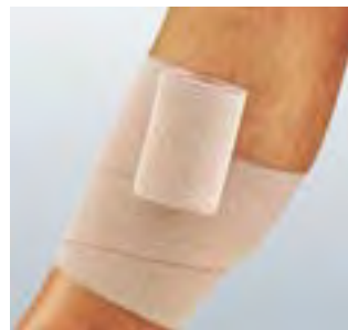
Comprihaft® verklebt nicht mit der Haut oder den Haaren.

Comprihaft® besteht aus 100% Baumwolle, mit mikroporöser Latexbeschichtung.