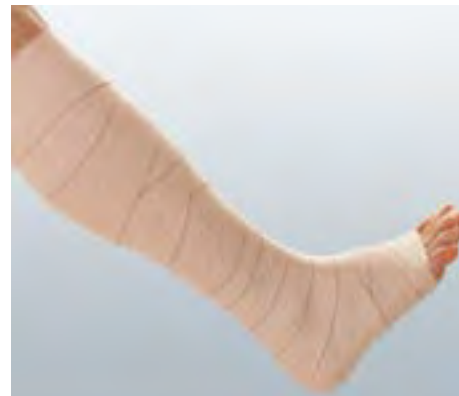
Für phlebologische und lymphologische Versorgungen.