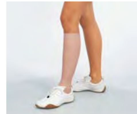
Für Stütz- und Entlastungsverbände.