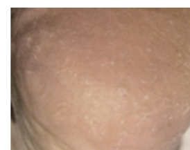
Haut ist elastisch und intakt