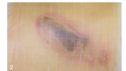
2 Hier beginnt das autolytische Débridement. Sekundärverband: Comfeel Plus Flexibel