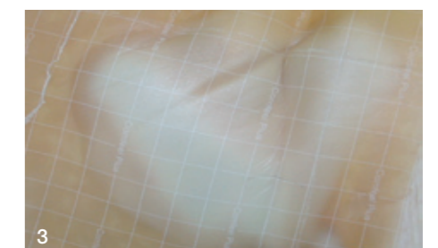
3 Comfeel Plus Flexibel nimmt überschüssige Feuchtigkeit auf und bildet eine Gelblase