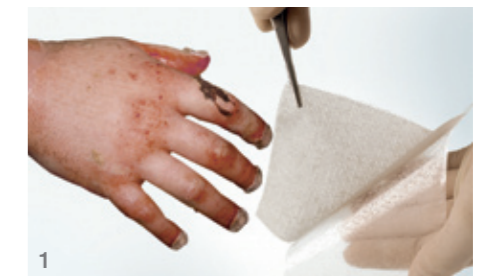
1 Entfernen des Schutzpapiers