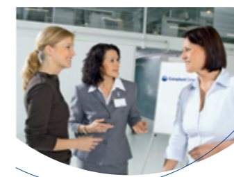
Das Coloplast-College-Schulungsprogramm Kompetenz für mehr Lebensqualität