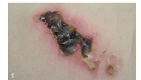
1 Applikation von Purilon Gel auf eine nekrotische Wunde