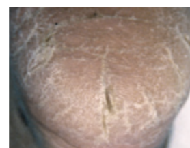
sehr trockene, rissige Haut