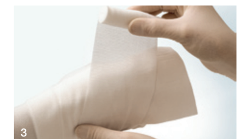
3 Fixierung des Verbandes mit einer Mullbinde