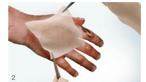
2 Applikation von Physiotulle mit einer Pinzette