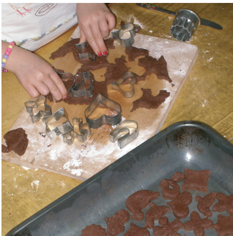
ERDMANDELFRÜHSTÜCK ENRGY-MIX PLUS ERDMANDELPLÄTZCHEN