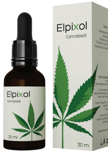
Elpixol Cannabisöl Inhalt: 30 ml. PZN: 16612544