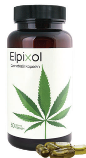
Elpixol Cannabisöl Kapseln 60 St. PZN: 17902764 UVP: 29,95 €