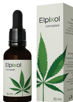
Elpixol Cannabisöl Tropfen 30 ml PZN: 16612544 UVP: 39,99 €