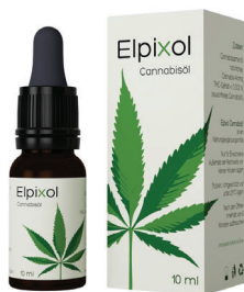
Elpixol Cannabisöl Tropfen 10 ml PZN: 16612550 UVP: 19,99 €