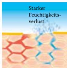
Lipidverlust führt zu einer gestörten Hautbarriere: Die Haut verliert viel Wasser und trocknet aus.

Linola PLUS-Serie mit Linola PLUS Creme, Linola PLUS Hautmilch, Linola PLUS Kopfhaut-Tonikum und Linola PLUS Shampoo entwickelt worden.